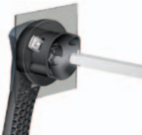
LBS-GC (CLBS-EH80, 125)