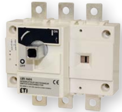
LBS 160 3P