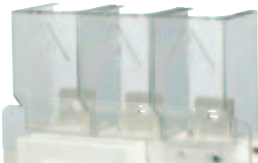
LBS-TS160 3P (CO)